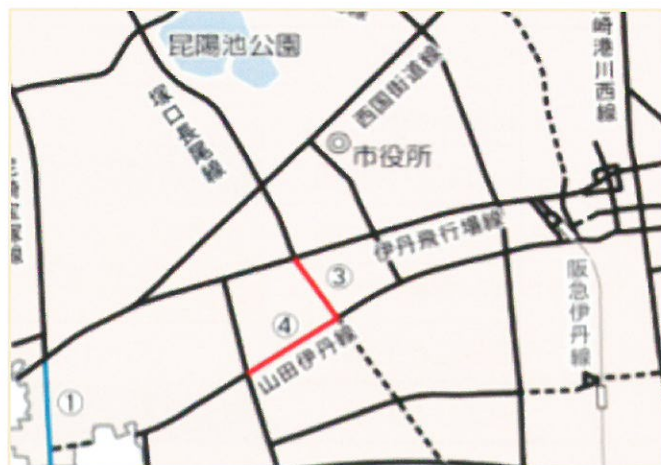
(伊丹市の資料より)

が、本当にそれだけの費用をかけて、地域の人たちの反対を押し切って大きな道路を造ることが、どうしても今の時代に必要なのか、と悩むところではあります。市長は対象地域の住民の皆さんの声を十分に聴きながら進めていく、と答弁しています。今後の展開を注視してまいります。