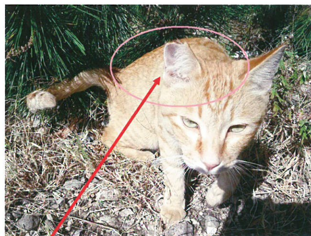
不妊去勢手術をされた猫は、耳をこのようにカットされて戻されるので「さくら猫」と呼ばれます

今回請願の趣旨は、助成金制度を作りたいというものでした。手術をして元に戻すだけでは野良猫被害は減りません。野良猫を地域猫と位置付け、誰かが面倒を見、責任を持つことで野良猫被害が減ります。また、手術をした猫だけにエサをやっているつもりでも、管理が適切でなければ他の猫やカラスのえさにもなり、環境の悪化も考えられます。