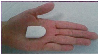
ビーコン発信機(イメージ)

伊丹市から説明のための資料で示されたカメラとビーコンのイメージです。ビーコンは発信機として、対象者が身につけて持つことで、カメラに付けられた受信機に反応し、居場所が特定できます。