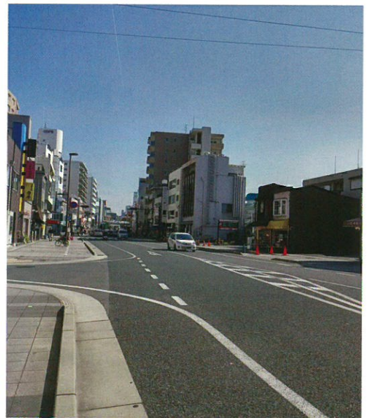
（常岡病院から阪急伊丹駅の方を見る）

日本の狭い道路や歩道に木を植えるのは、そもそも無理があります。植えた時は細くても、想像を超えるくらいに大きくなります。目先の綺麗さとニーズだけではなく、長いスパンで見ると、都市を創っていくのが行政の仕事です。