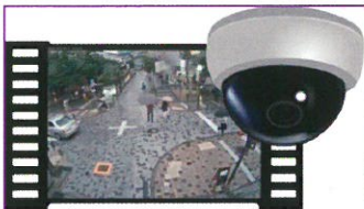
安全・安心見守りカメラ(イメージ)