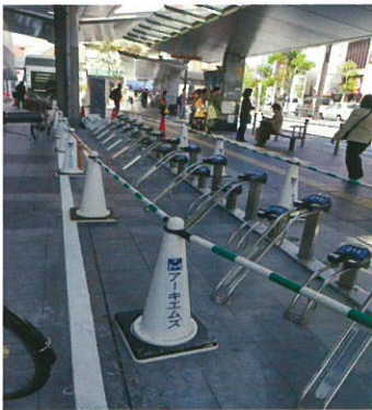
阪急伊丹駅前に設置された駐輪ラック、ここ以外に止めおくと撤去の対象となります。